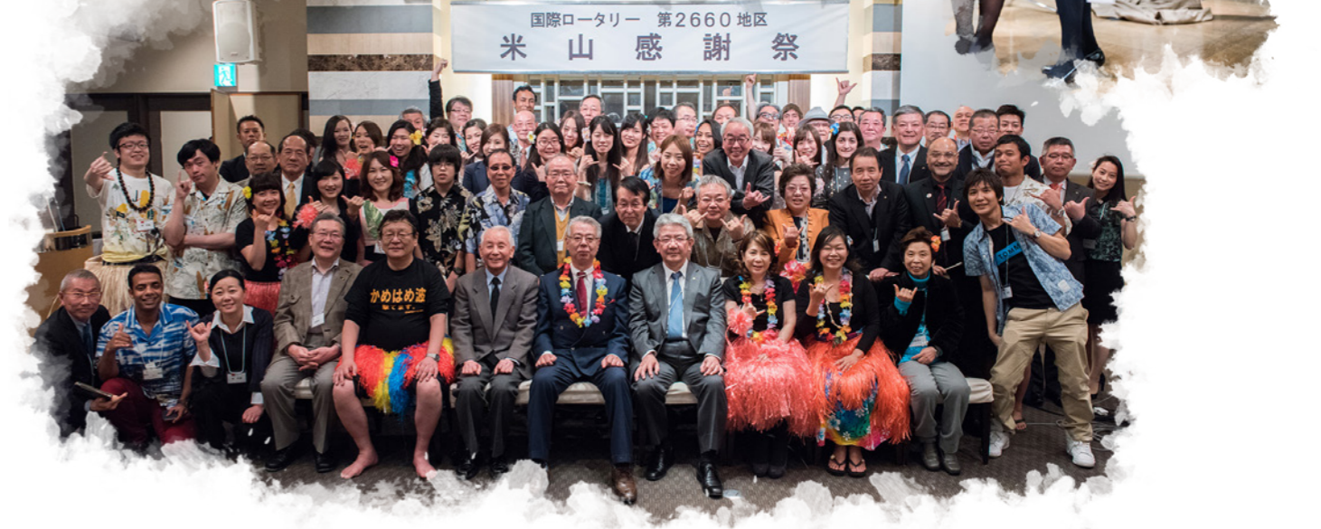
国際ロータリー 第2660地区 米山感謝祭