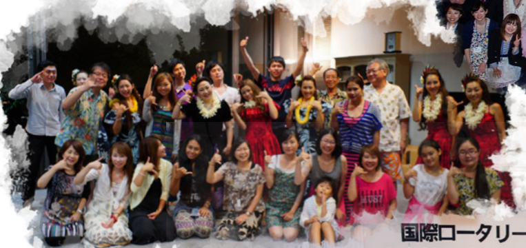
国際ロータリー第2660地区 米山奨学生レクリエーション大会