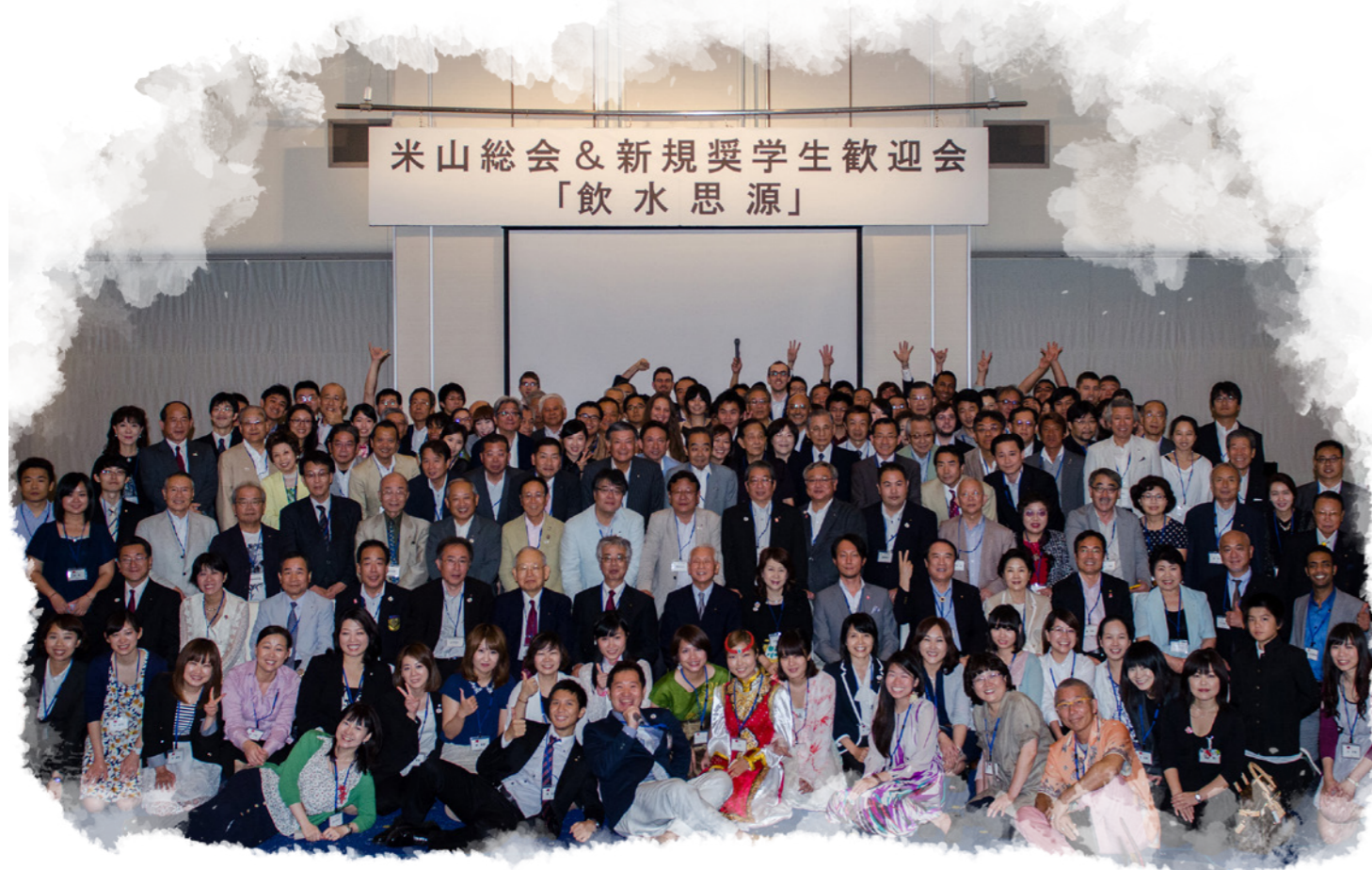
ロータリアン 83 名、現役奨学生 37 名、米山学友 46 名、家族 4 名合計 170 名

場所：KKR ホテル大阪 日付：2014 年 7 月 6 日 17：00～20：30 分